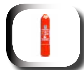
Bouteille forgée en acier léger à 250 bars, selon directive des appareils sous pressions 97/23/CE