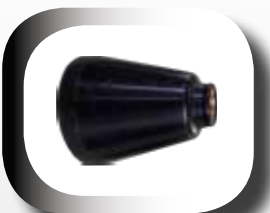
Tromblon permettant de cibler la base du feu.