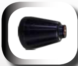
Tromblon permettant de cibler la base du feu.