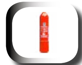
Bouteille forgée en acier léger à 250 bars, selon directive des appareils sous pressions 97/23/CE